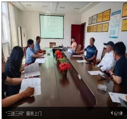
“三送三问”服务上门